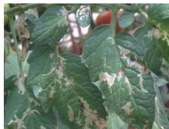
dégât sur feuilles