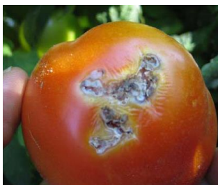
dégât sur fruit