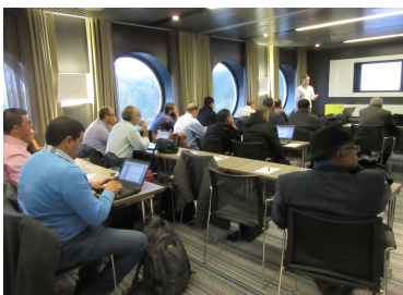
Réunion à bord d'un bateau, projet MISSION à Stockholm, Suède (8-10/10/14).

Trois projets européens Tempus font l'actualité des mois d'octobre et novembre pour le BM avec tout d'abord le dernier atelier du projet MISSION pour lequel le consortium s'est retrouvé à Stockholm (Suède) du 8 au 10 octobre. Accueilli par l'Université KTH, le groupe a traité des questions relatives à la sécurité des Systèmes d'Information et de Communication. C'est ici l'implémentation de l'ERP ( Enterprise Resource Planning ) par l'intégration de quatre briques métiers (scolarité, patrimoine, GRH et Gestion financière) dans les universités marocaines qui est visée.