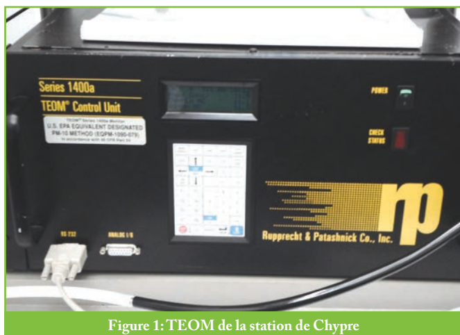
Figure 1: TEOM de la station de Chypre