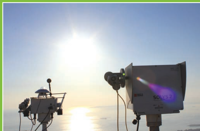
Professeur N. YASSAA, Directeur du CDER

Les données mesurées par le réseau CHEMS, sont consultables, en temps réel (mise à jour chaque 5 minutes), sur le site WEB du portail Algérien des Energies Renouvelables.