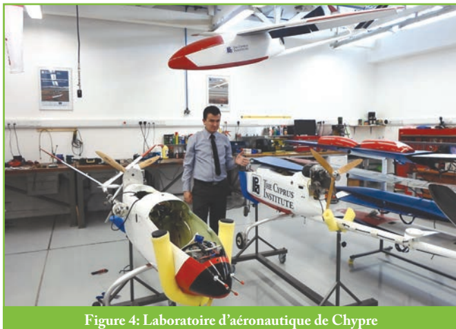
Figure 4: Laboratoire d'aéronautique de Chypre

Mon expérience au CDER avec l'aethalometer AE33 m'a permis de suivre les résultats de mesures des aethalometers AE31, les aethalometers AE51, le TEOM et l'OPC de Chypre ; du téléchargement des données aux comparaisons entre chaque deux appareils jusqu'à la présentation des données sous forme de graphes exploitable dans un futur article scientifique.